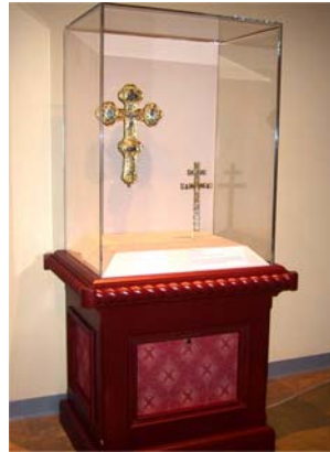
i-Guide Point 电子标签可隐藏安装